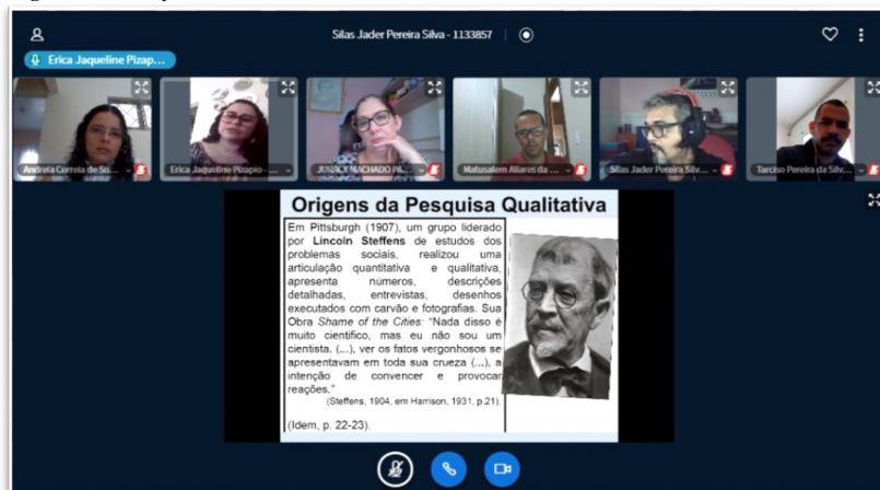
Figura 2 - Participantes do Seminário II APE.

Fonte: Arquivo dos grupos de pesquisa: EDUCA/UNIR e GEPEIN/UNIR, 30/04/2020.